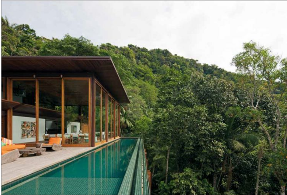
AMB house, Taguaiba SP - Brésil.