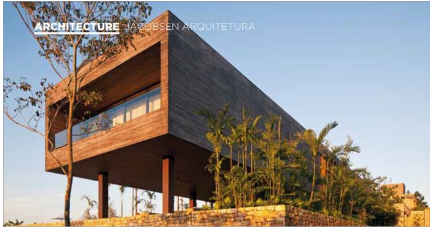
CT house, Quinta da Baroneza SP - Brésil