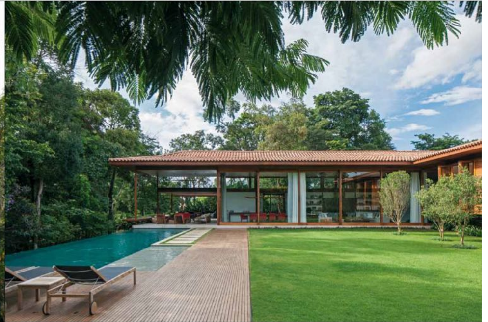
GR House, Itu SP - Brésil.