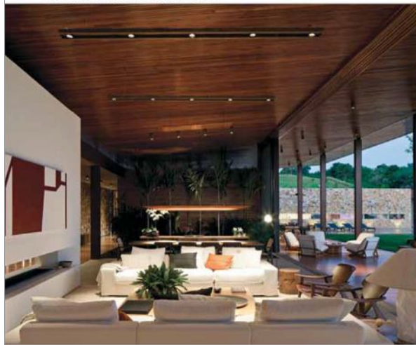
BV House at Fazenda Boa Vista, Porto Feliz SP - Brésil